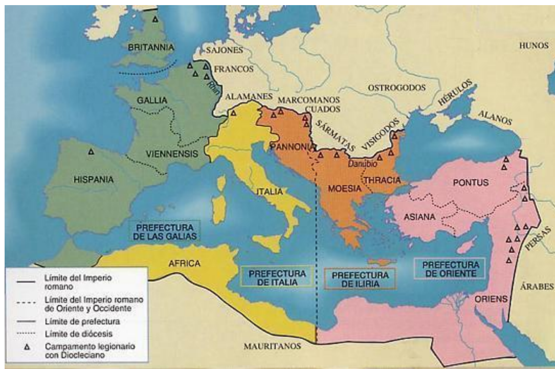
Reorganización general del Imperio por Diocleciano en 293

(Gráfico atlas histórico Ed. Santillana).